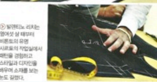
발렌티노 리치는 양어섯 살 때부터 비몬토의 유명 사르토의 작업실에서 패턴을 공부하고 스타일과 디자인을 배우며 소재를 보는 눈도 길었다.