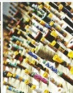
발렌티노 리치는 매일 VIP 고객을 대상으로 맞춤 행사를 진행한다. 그때는 발렌티노 리치라는 100% 핸드메이드 비스코프 방식의 브랜드로 진행한다. 사맛은 국소왕의 기계 작업을 통해 생산 속도를 높인 브랜드다.